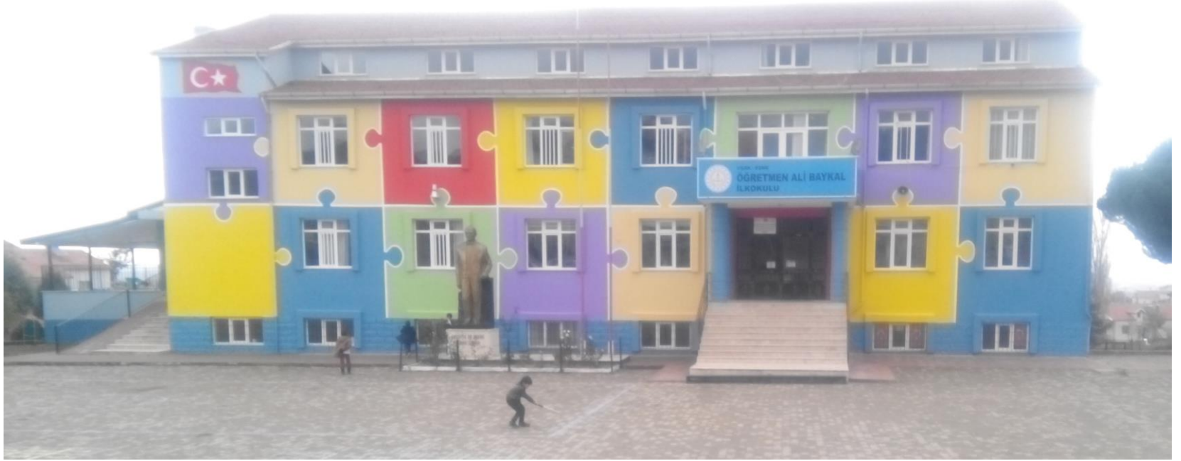
ÖĞRETMEN ALİ BAYKAL İLKOKULU